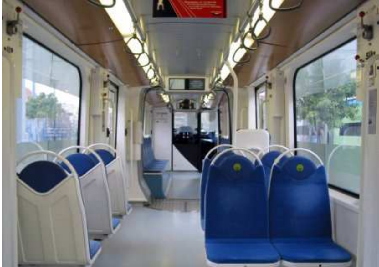
Εικόνα 6 Εσωτερικό του Οχήματος Τραμ σειράς 1