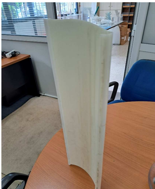
Εικόνα 1 Όψη Καλύμματος πλαφονιέρας φωτισμού Sirio