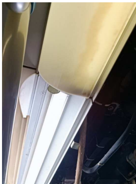
Εικόνα 4 Όψη Καλύμματος πλαφονιέρας φωτισμού Sirio