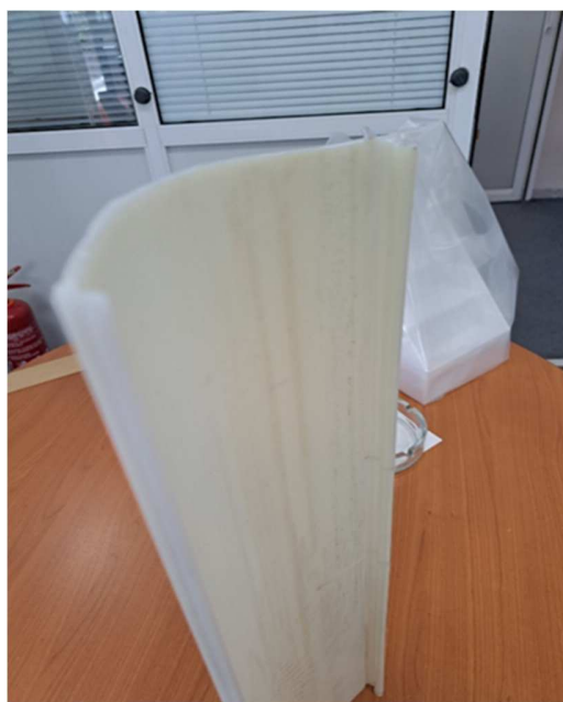
Εικόνα 2 Όψη Καλύμματος πλαφονιέρας φωτισμού Sirio