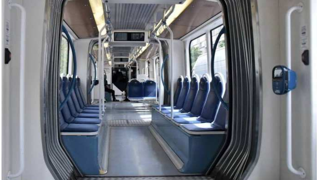
Εικόνα 5 Εσωτερικό του Οχήματος Τραμ σειράς 1