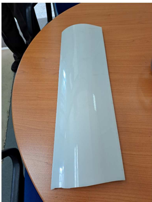
Εικόνα 3 Όψη Καλύμματος πλαφονιέρας φωτισμού Sirio